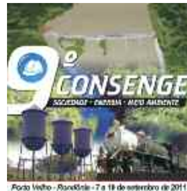
Porto Velho - Rondônia - 7 a 10 de setembro de 2011

Os sindicatos também já indicaram nomes para as palestras que tratarão dos seguintes temas: A questão de gênero; A cidade sustentável; Integração da América Latina e Energia, Recursos Minerais e Desenvolvimento . O 9º Consenge será realizado entre os dias 7 e 10 de setembro de 2011, em Porto Velho, Rondônia.