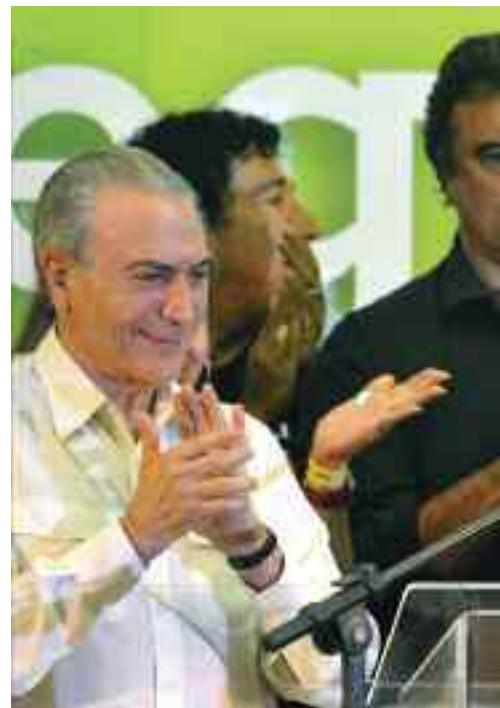
Depois de dura campanha, ataques da mídia e da di