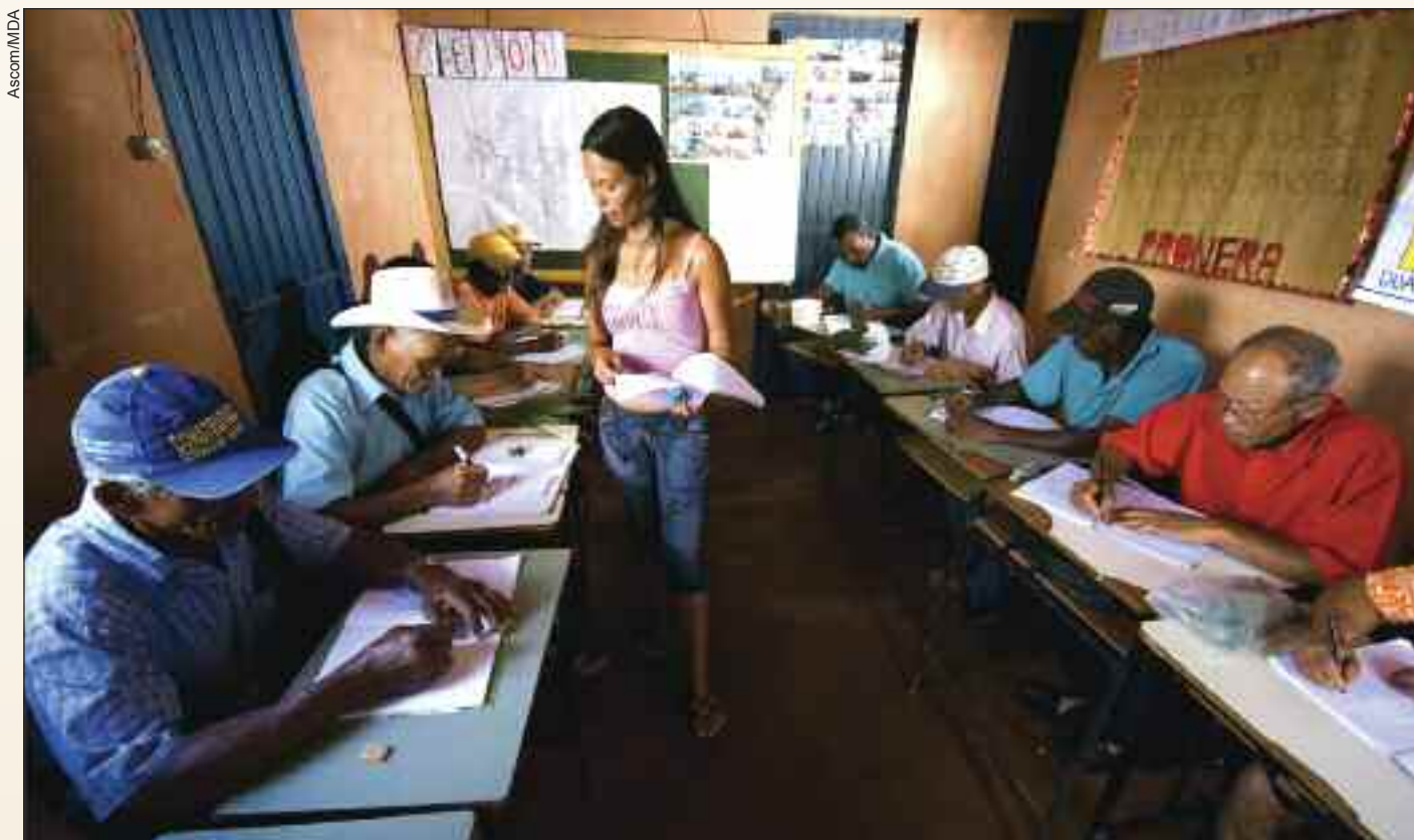
O MST foi o primeiro movimento que encaminhou a proposta de ensino superior para o Pronera

A escola deve cumprir preceitos básicos como o respeito à diversidade nos aspectos sociais, culturais, ambientais, políticos, econômicos, de gênero, raça e etnia. A população atendida compreende agricultores familiares, extrativistas, pescadores artesanais, ribeirinhos, assentados e acampados da reforma agrária, trabalhadores rurais assalariados, quilombolas.