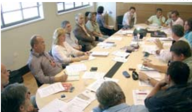
Ação: líderes sindicais planejam próximas etapas da Jornada

amos utilizar todo o nosso conhecimento acumulado para contribuir com a Central e com a defesa de uma plataforma nacional para os trabalhadores", afirmou.