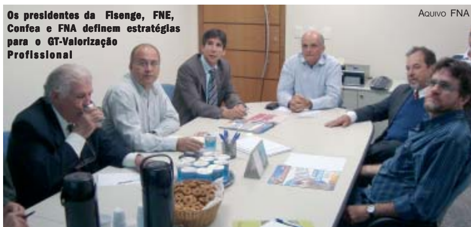
Os presidentes da Fisenge, FNE, Confea e FNA definem estratégias para o GT-Valoração Profissional