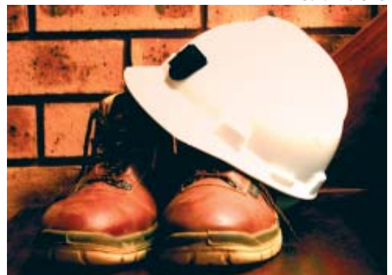
Restou aos profissionais demitidos do CREA-SC apenas o recolhimento de seus objetos pessoais