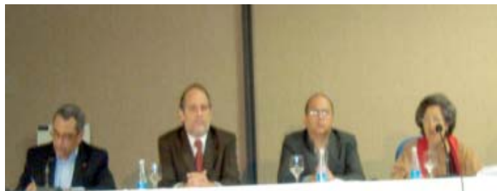
Seminário Fisenge discutiu o papel da América Latina no novo cenário mundial

Tornar mais conhecida a função social da engenharia: o conhecimento e a capacitação dos engenheiros devem estar à disposição da sociedade e alinhados ao desenvolvimento da nação.