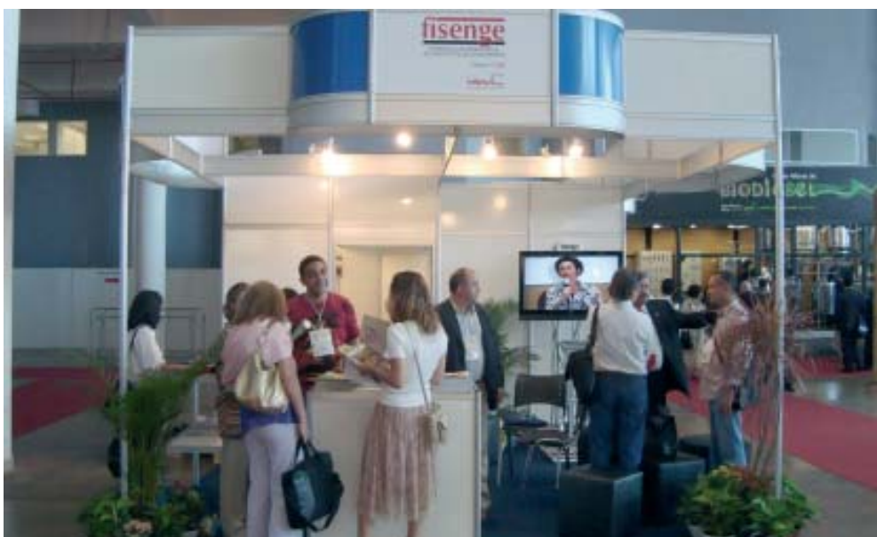
O estande da Fisenge na WEC2008 recebeu grande número de visitas

Trabalhar na articulação e mobilização da sociedade civil organizada para a elaboração de um "Macroplano Diretor de Política Energética" que otimize o uso racional dos recursos conforme os interesses socioambientais.