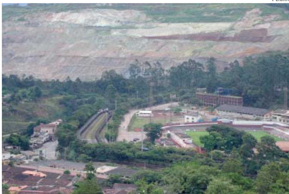
Mina do Cauê, em Itabira, MG, cidade mais atingida pelas demissões anunciadas pela empresa

A Fisenge repudia a decisão da empresa de redução dos quadros. Esta atitude joga para os funcionários o ônus da falência do sistema financeiro mundial. Mais uma vez são os trabalhadores que dividem o prejuízo entre si. Nenhum deles participou de forma ativa, democrática e equânime nos lucros da empresa em todos esses anos.