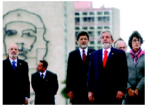
Presidente Lula durante cerimônia na capital cubana

Em visita a Havana, Cuba, no dia 15 de janeiro, o presidente Lula assinou uma dezena de acordos comerciais com o país, no Palácio da Revolução. Dentre os acordos, destaca-se o firmado entre as empresas Cupet e Petrobras, para exploração de petróleo em águas profundas cubanas do Golfo do México. Os investimentos brasileiros em Cuba devem se aproximar de US$ 1 bilhão.