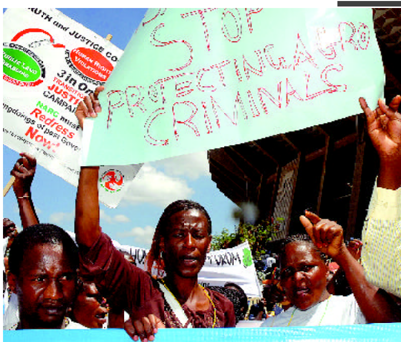
Nairóbi (Quênia) – "Parem de proteger agro-criminosos", diz faixa em manifestação no 7º FSM